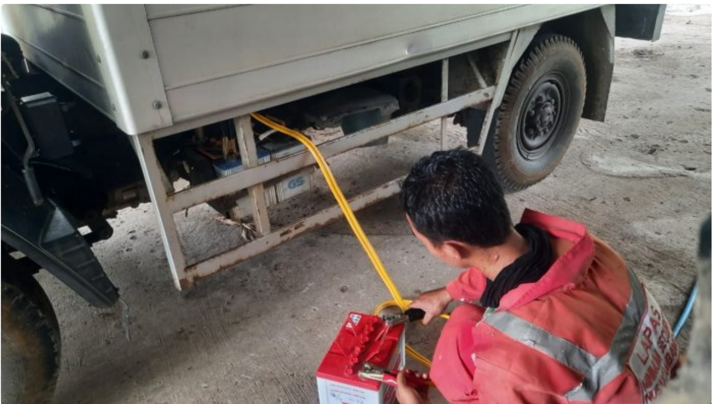
Petugas Staf Umum Lakukan Pengecekan