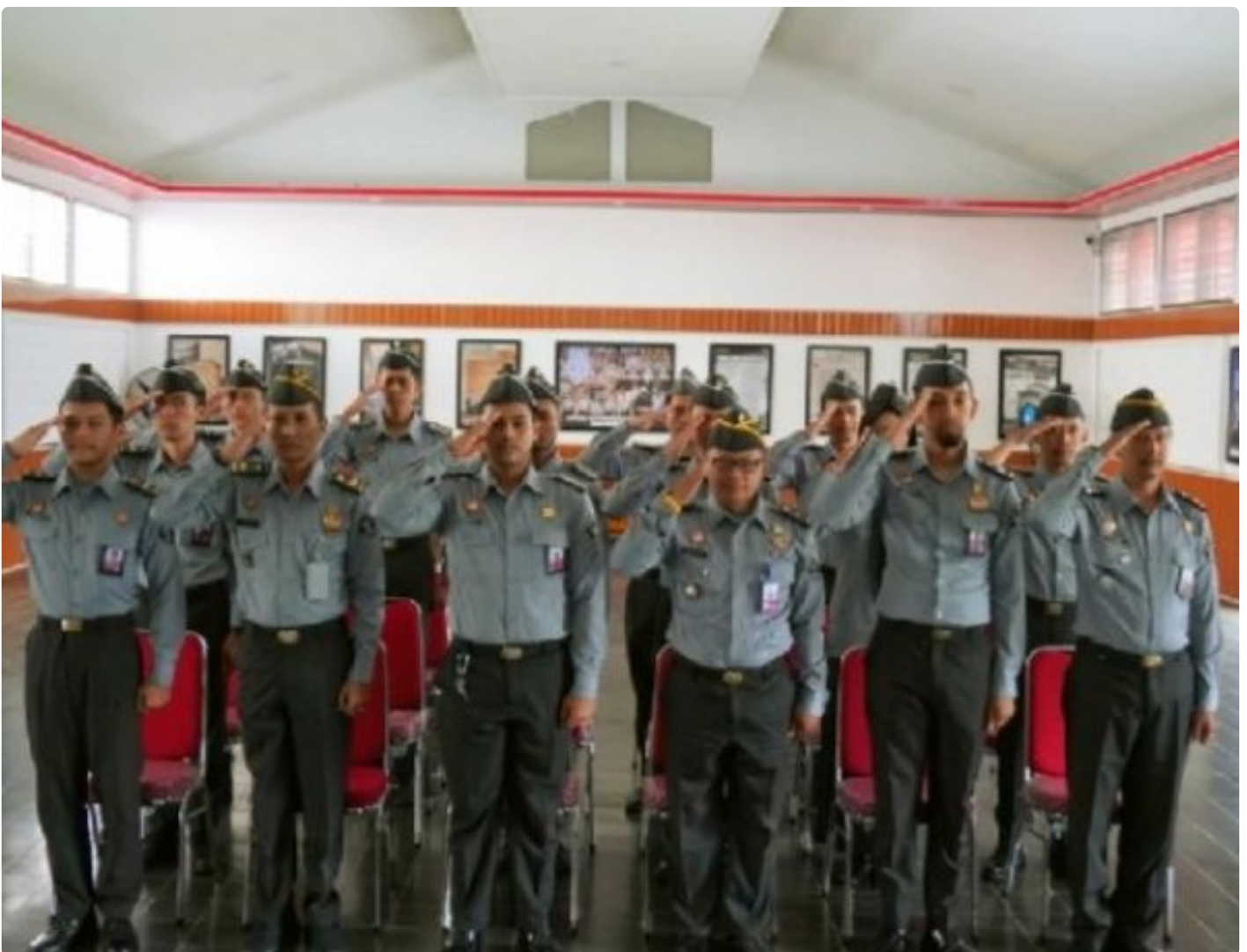
Jajaran Lapas Besi Hadiri Apel Pagi Pegawai dan Halal Bihalal Bersama Kemenkumham RI

CILACAP – Jajaran Pegawai Lembaga Pemasyarakatan Kelas IIA Besi Nusakambangan menghadiri kegiatan Apel Pagi Pegawai dan Halal Bihalal Idul Fitri 1445 H yang diselenggarakan oleh Kementerian Hukum dan Hak Asasi